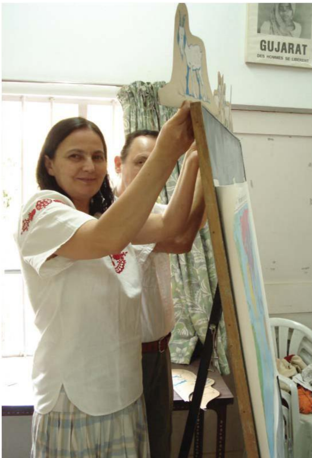
A BOCS Alapítvány trénerai az indiai falusi nevelők ökológiai képzésén kecskékkal játszották el a közlegelő tragédiáját, a csoportokra osztott résztvevők valóságos döntései alapján.